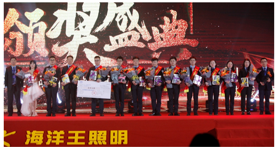
2018年服务中心优秀奖第三名—上海冶金服务中心