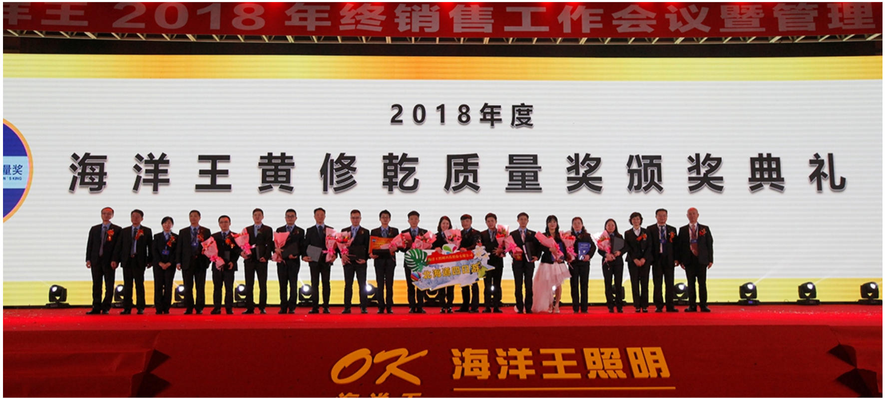
“黄修乾质量奖” 质量奖—上海冶金服务中心