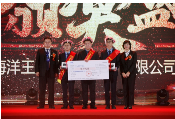
优秀服务部第一名 军品二服务中心_一服务部