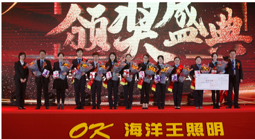
2018年服务中心优秀奖第二名—华东公安消防服务中心