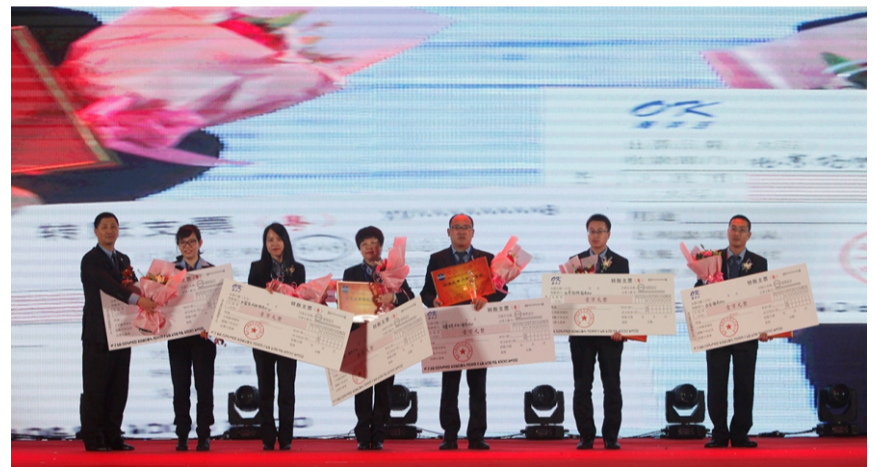
“黄修乾质量奖” 鼓励奖—南京网电、乌鲁木齐石化、 军品二、西安（冶金）、北京场馆、石家庄网电服务中心