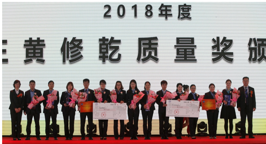
“黄修乾质量奖” 提名奖—西安电煤服务中心 华东公安消防服务中心