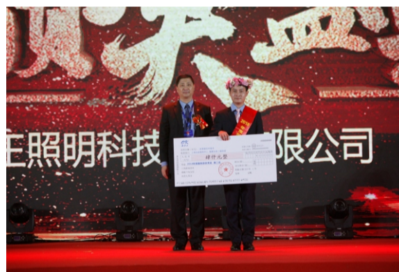
优秀服务部第二名 上海冶金服务中心_福建冶金二服务部