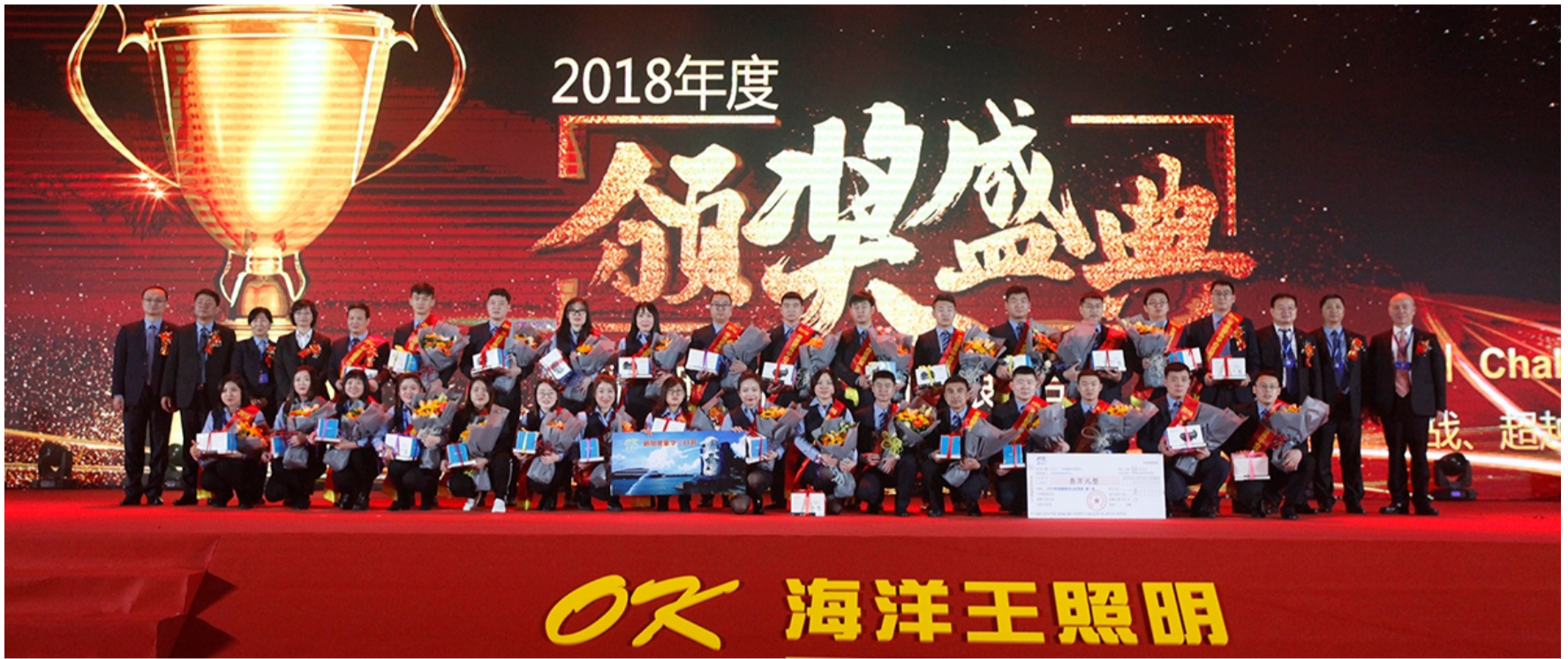
2018年服务中心优秀奖第一名—沈阳网电服务中心