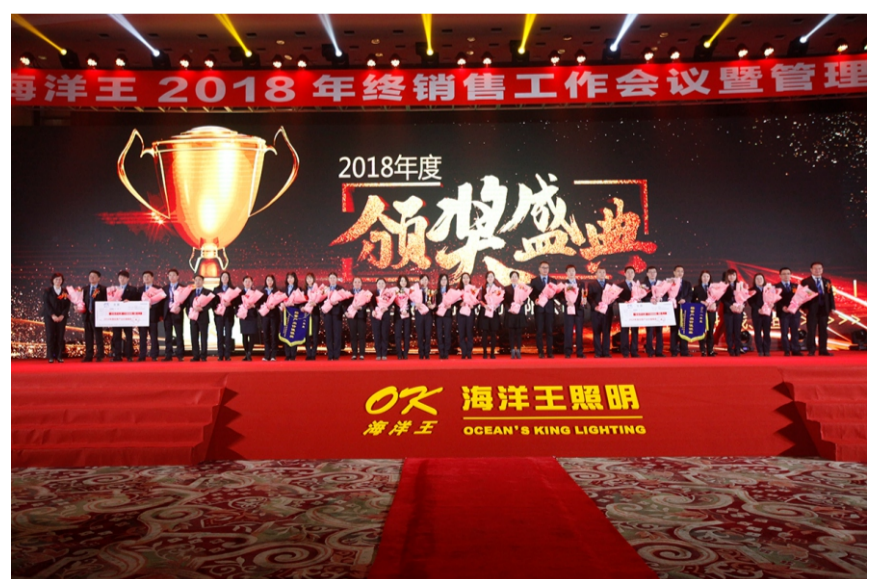
行业经营价值产出银奖—公安消防事业部 冶金事业部