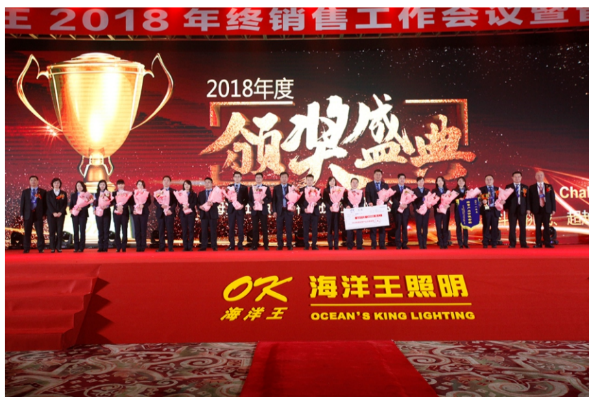
行业经营价值产出金奖—铁路事业部