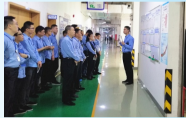
东莞基地质量活动中心形成问题解决