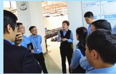
王总现场对质量问题进行解决