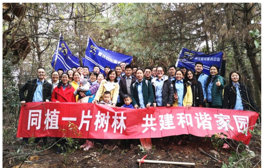
重庆石化、重庆网电、重庆公消联合在重庆市南岸区举行了植树活动

植树造林，绿化祖国，是每个公民应尽的义务，是一项功在当代、福及子孙的好活动。植树活动不仅增强大家植