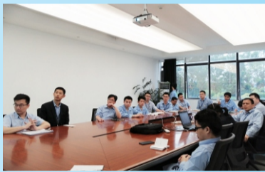
成品保证部学习标准