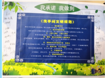
技术设计部“文明洗手间”活动