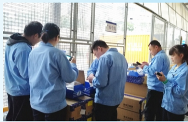
成品检验组4G产品出货检查培训