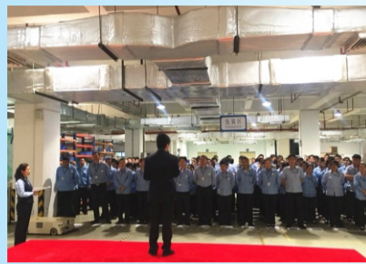
工厂宣贯质量月活动

在公司质量月活动启动大会后，供应链管理各二级部门分别召开了质量月活动的宣贯会，让员工更加详细的了解本届质量月活动的主题和本部门的质量月活动计划，并要求在做好本职工作的前提下，按照计划去落实每一个质量月计划的具体事项，管理人员定时检查评比。为更好的履行工作职责，物料采购部进一步完善了采购专家团周例会制度；为快速解决生产质量问题，与品质保证部一起召开品质早会活动；工厂从解决问题、提升管理的角度出发，对现场管理看板重新设计；计划运作部与IT支持部就关于计划管理各模块工作流程进行梳理，解决ERP系统对计划工作支持不足的问题。除此之外，3月份工厂还进行了“为你点赞”、“质量效率我承诺”活动的评选，开展了员工技能竞赛活动。