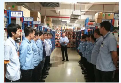
仓库宣贯质量月活动