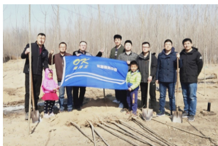
东营服务中心植树活动