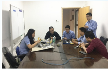
来料保证部召开物料质量问题解决会议