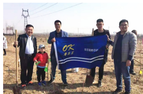
任丘服务中心植树活动