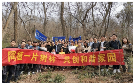
南京网电、南京船舶、南京石化三服务中心联合植树活动