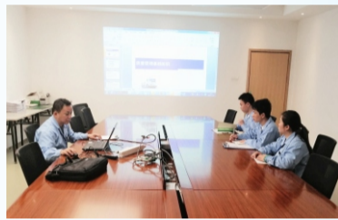
新员工质量知识培训