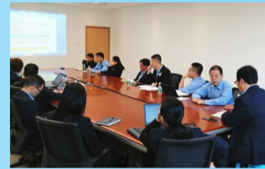
标准化执行落实整改会议