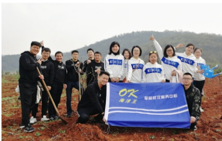
军品武汉服务中心植树活动