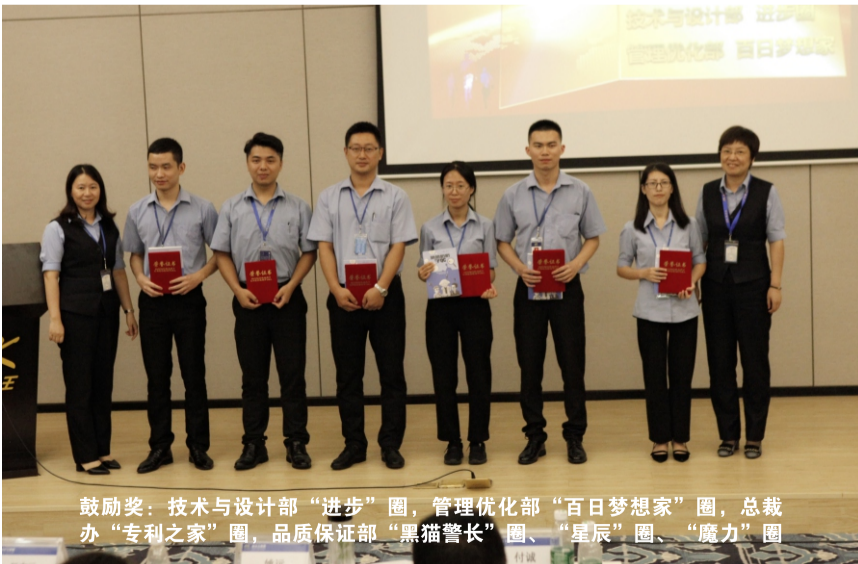
鼓励奖：技术与设计部“进步”圈，管理优化部“百日梦想家”圈，总裁办“专利之家”圈，品质保证部“黑猫警长”圈、“星辰”圈、“魔力”圈