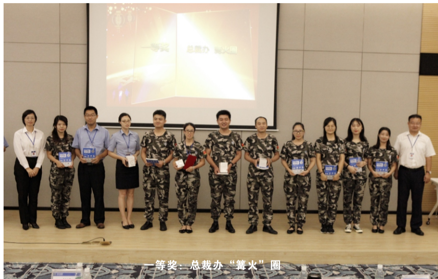
一等奖：总裁办“篝火”圈

公司一直以来都重视QCC管理，通过开展QCC活动，圈长积极寻找、面对工作中存在的问题，圈员和圈长之间相互帮助，共同寻找、研究解决办法，最终解决问题，达成目标。