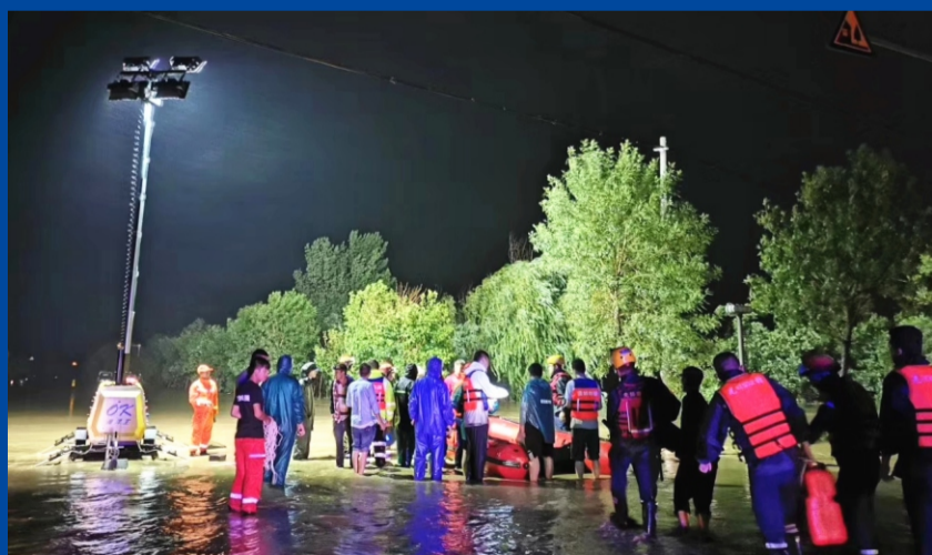
8月10日，16级超强台风“利奇马”在我国沿海登陆，随后一路北上，导致我国东部、北部多个地区遭受了严重的洪涝、暴雨灾害。面对灾害，海洋王人第一时间联系客户，提供紧急照明支援，有序组织人员带上救援灯具积极投入抢险救灾，支援灾区重建。（图为济南公消服务中心在章丘灾区参与照明支援）