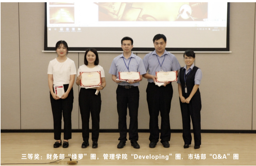
三等奖：财务部“绿萝”圈，管理学院“Developing”圈，市场部“Q&A”圈