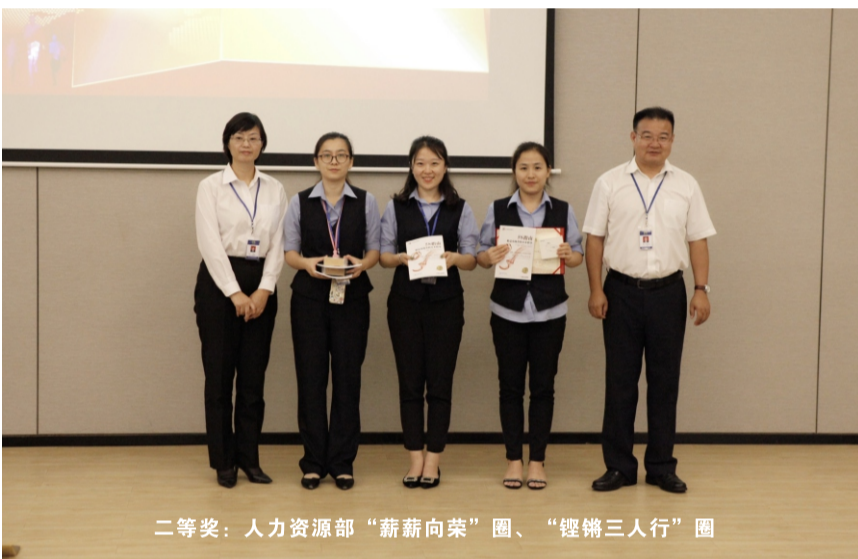
二等奖：人力资源部“薪薪向荣”圈、“铿锵三人行”圈